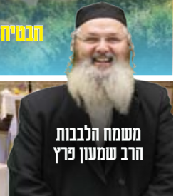
משמח הלבבות הרב שמעון פרץ