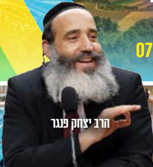
הרב יצחק פנגר